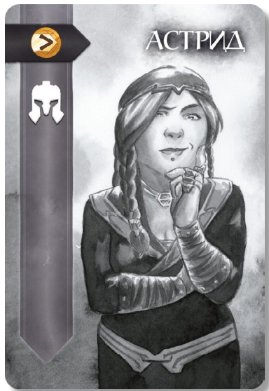
Карта героя – Астрид.

ценность, но она всего лишь суммируется.