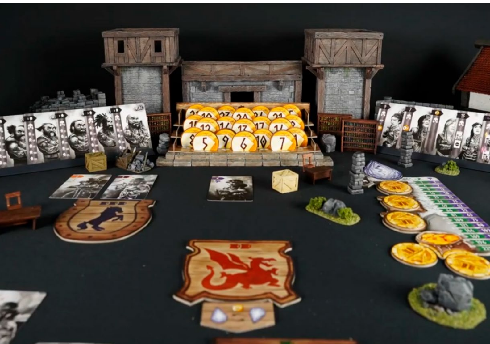
Кадр из короткого ролика об игре. Кликните, чтобы посмотреть целиком.