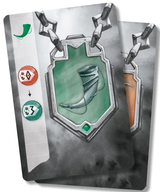
Карты знаков отличия

В Нидавеллире нет единственно верного способа победить! Всё зависит от всех!